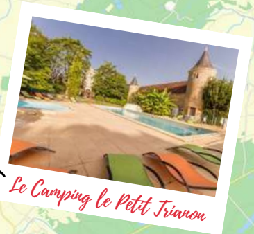
Le Camping le Petit Trianon