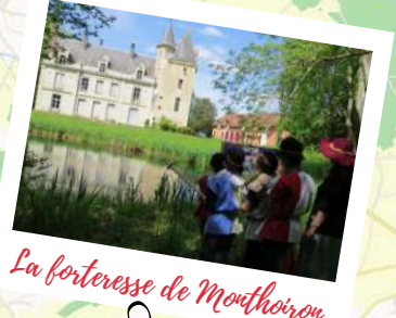
La forteresse de Mouthoiron

47 km d'itinéraire en Grand Châtellerault