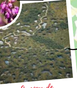
Au coeur de la forêt Moulrière...