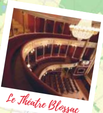
Le Théâtre Bressac