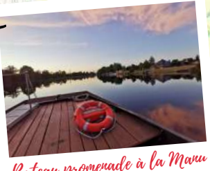
Bateau promenade à la Mauu

47 km d'itinéraire en Grand Châtellerault